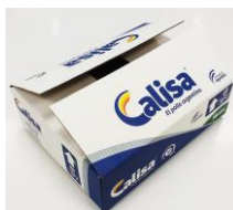
ENVASE SECUNDARIO Caja x5Kg Impresa Calisa con rótulo

A pesar de las rigurosas medidas implementadas en planta, el producto podría llegar a contener algún fragmento de hueso de pollo