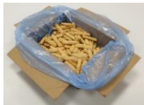
ENVASE PRIMARIO Bolsa Celeste x 5 kg