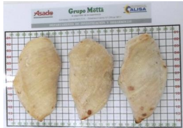
Foto Ilustrativa del Producto Congelado

SENASA N° 3811/110591/3 (x 1 Kg) 3811 /110591/1 (x 5Kg)